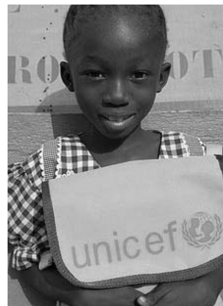
Il manifesto di una campagna dell'Unicef

«Le associazioni di volontariato devono capire, secondo me, che è meglio abbandonare la spontaneità e l'artigianalità dell'esperienza quotidiana che possiede tanto cuore, ma spesso produce poco risultato in termini di riuscita concreta degli obiettivi prefissati. In molti casi i volontari disperdono le loro energie e le loro risorse in iniziative poco utili. Non basta più la semplice dedizione. Bisogna, ad esempio, puntare moltissimo sulla comu-