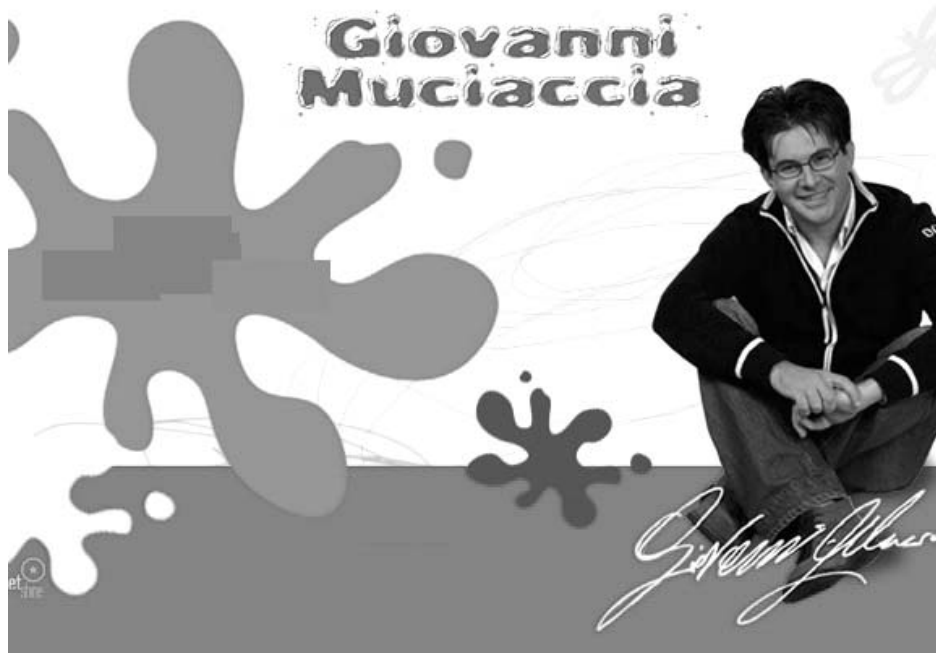
In alto un gazebo del Centro missionario diocesano giovanile di Bari. A sinistra il celebre conduttore di Art Attack, Giovanni Muciaccia, testimonial dell'associazione emofiliaci