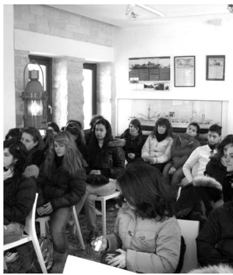
A destra una immagine di alcuni ragazzi che hanno partecipato con la «Vedetta» alla manifestazione «Mare d'inchiostro»

Alle ore 11 segue la premiazione degli alunni degli istituti dei licei A. Scacchi di Bari, M. Spinelli di Giovinazzo e E. Amaldi. I giovani volontari hanno collaborato con la Vedet-